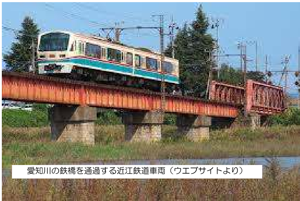
愛知川の鉄橋を通過する近江鉄道車両